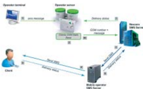
Схема на работа на SMS известяване